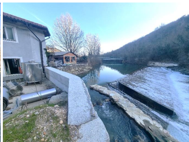
Slika 3: Pogled iz OC jugovzhodno proti mostu čez Vipavo