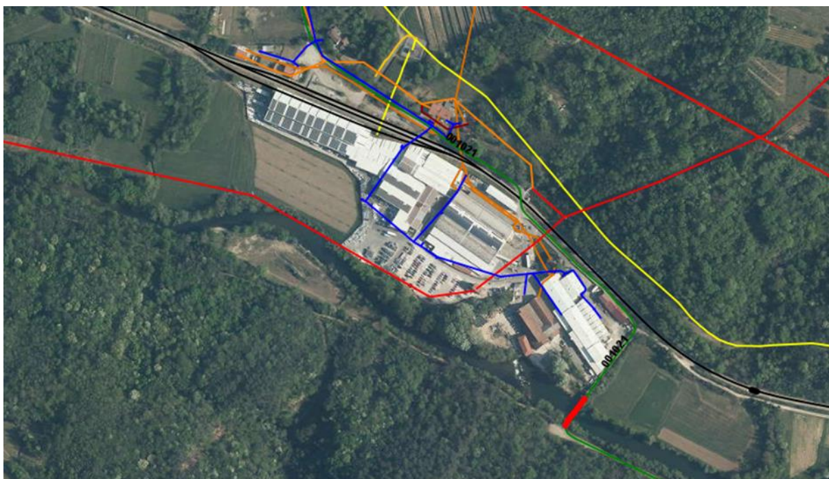
Slika 6: Območje OPPN s prikazom obstoječe GII

ali drugi material ter postavljatičasne objekte. Na mestih, kjer so predvidene vozne površine, na mestih križanj z drugimi infrastrukturnimi vodi in v primeru izvajanja del v njihovem varovalnem pasu, se obstoječe vode ustrezno zaščititi.