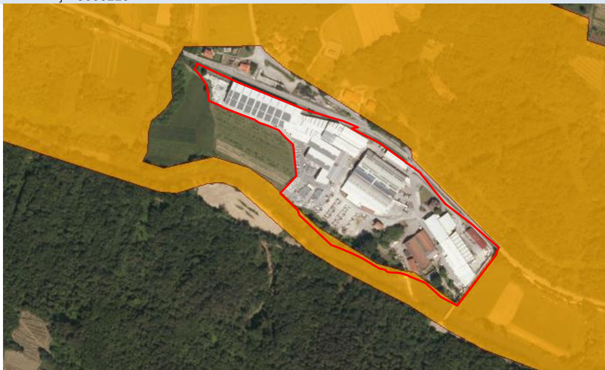
Slika_8: Ekološko pomembna območja