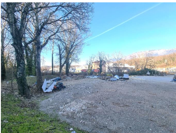
Slika 4: Južni del območja OPPN