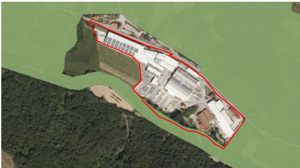
Slika_7: Območje Natura 2000