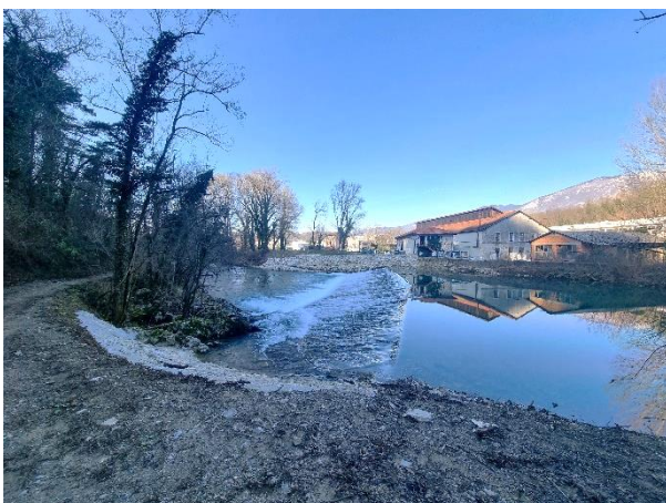
Slika 2: Pogled na OC z drugega brega reke Vipave