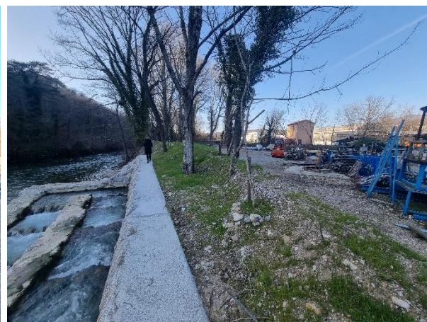
Slika 5: Pogled proti severozahodu, levo ureditev ribje steze