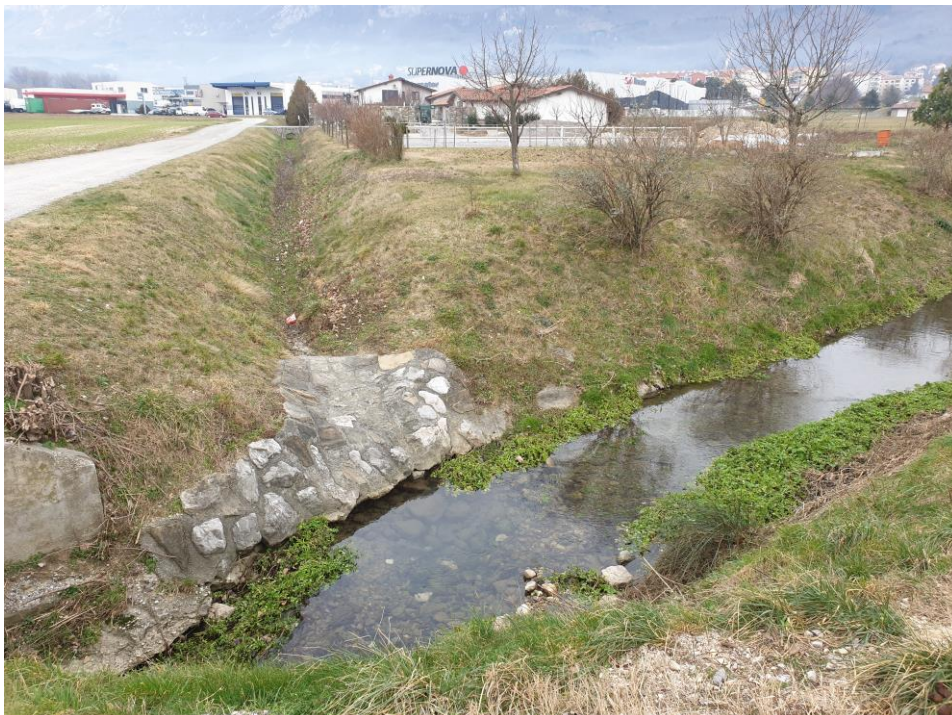
Slika 8: Obstoječe stanje odvodnika A in Kožmanskega potoka, v katerega se odvodnik izliva