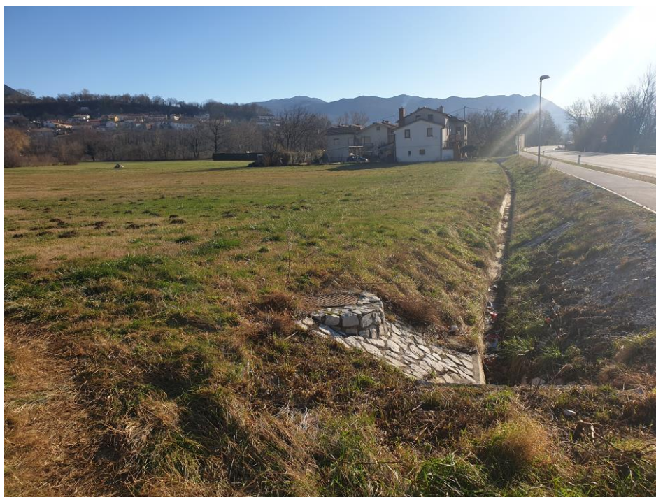
Slika 2: Jugo zahodno območje plana, slika je zajeta iz zahodne smeri, desno potek regionalne ceste Ajdovščina-Vipava