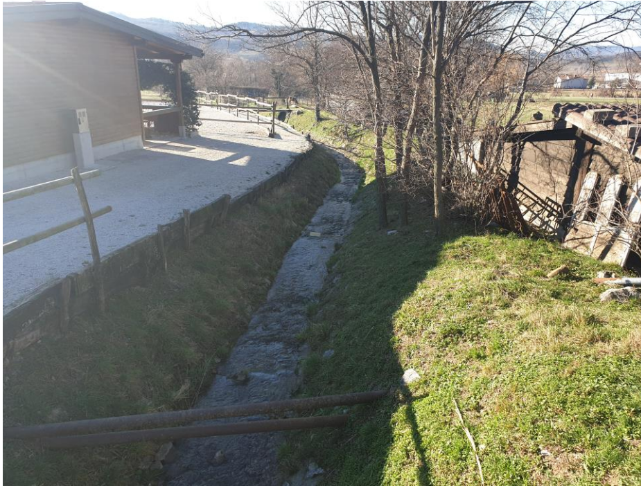
Slika 7: Potok Prelog, vzhodno od plana