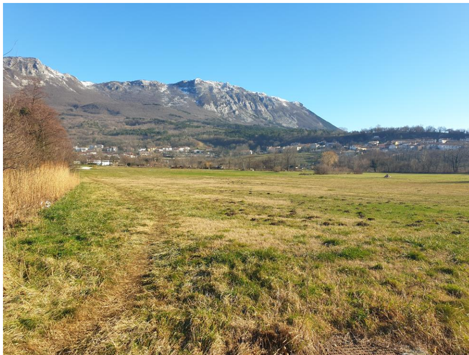
Slika 3: Pogled na celotno območje SD OPPN, slika je zajeta iz južne meje plana in kaže proti severu, v ozadju Gora