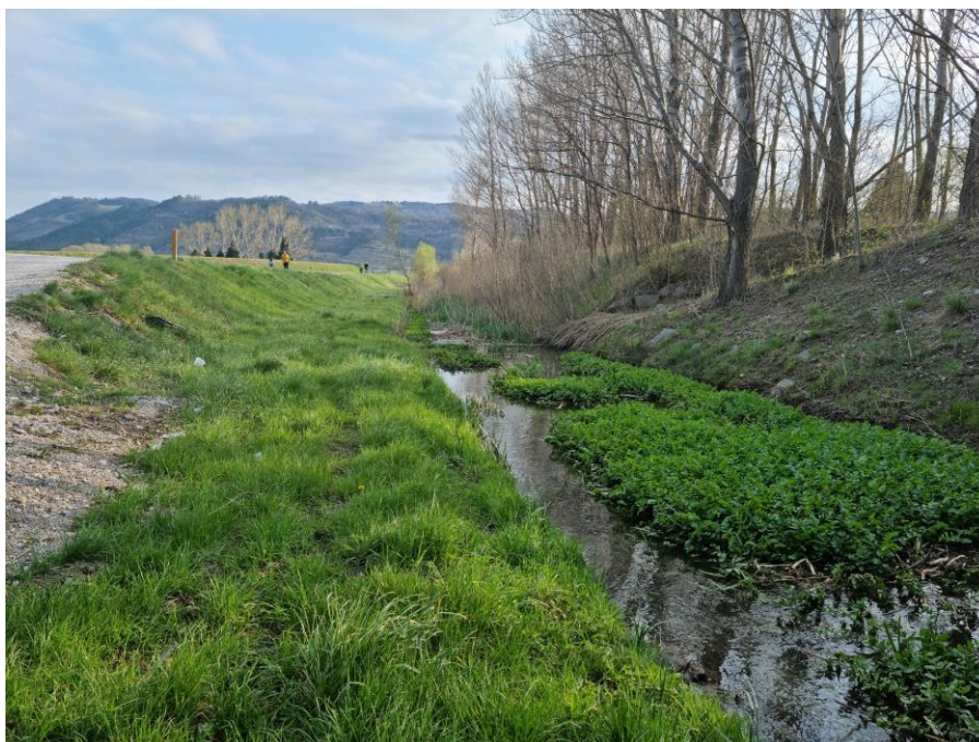
Slika 5: Struga Kožmanskega potoka nekaj 100 m pred izlivom v Hubelj, tik pod premostitvijo HC Razdrto - Vrtojba.