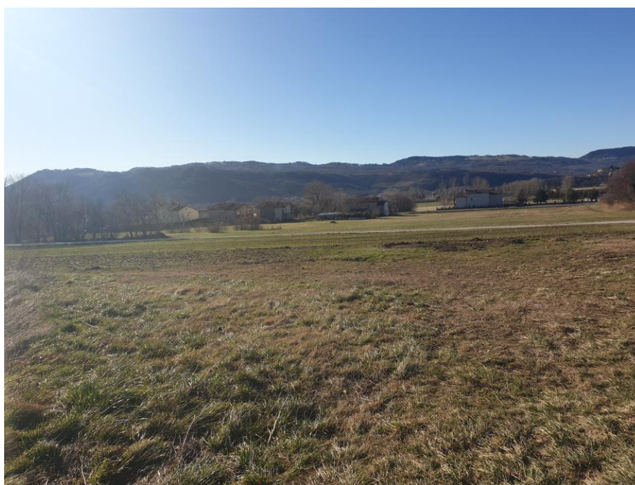
Slika 4: Pogled na celotno območje SD OPPN, slika je zajeta iz severne meje plana in kaže proti jugu, v ozadju Vipavska brda