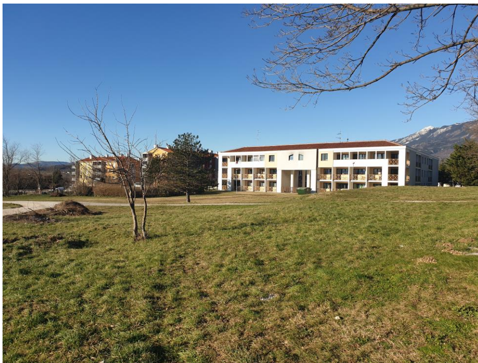
Slika 1: Osrednji del plana ob obstoječem DSO, fotografija je zajeta iz vzhodne smeri