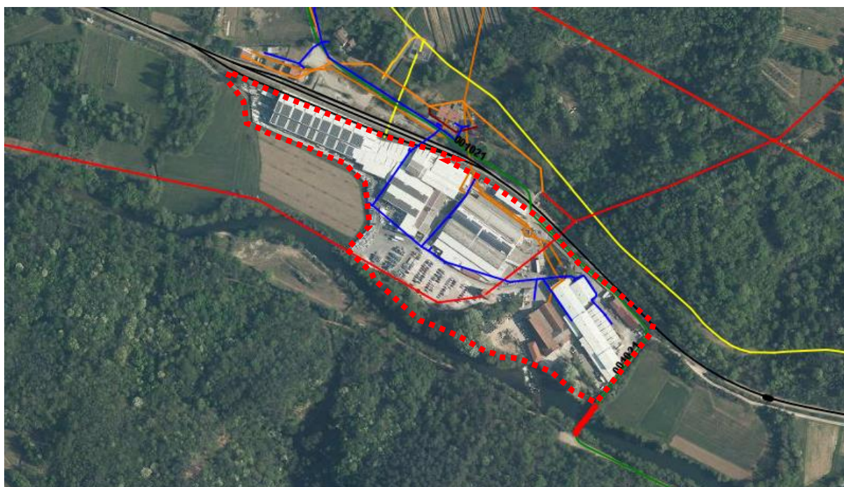
Slika_3: Območje OPPN s prikazom obstoječe GJI

Območje ureditve je v celoti komunalno opremljeno. Potrebne so sanacije in vzdrževanje obstoječe infrastrukture ter ureditev nove komunalne infrastrukture in sicer odvajanja meteornih vod.