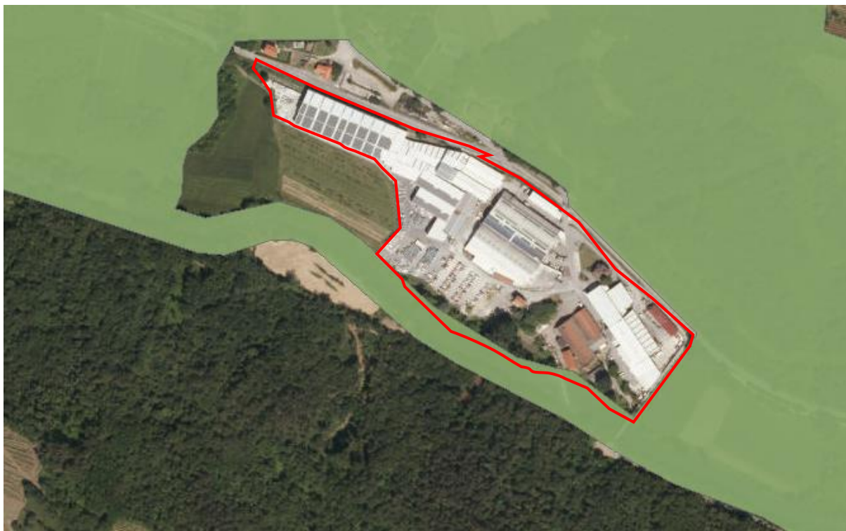
Slika_3: Območje Natura 2000

Ime območja: Dolina Vipave ID območja: 3000226