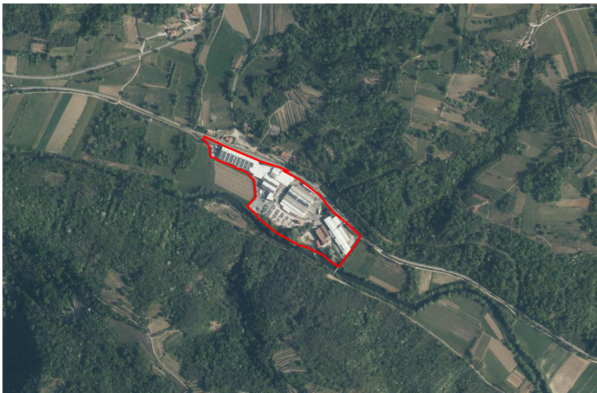
Slika_1: Območje predvidenega OPPN

Izven območja OPPN segajo ureditve prometnih površin ter komunalne infrastrukture (odvajanje meteornih voda) in sicer na dele parcel št. 1207/3, 1207/1, 1546/1, 1206, 1214, 1203, 1549/1, 1154/5, 1157, 1554, 1538/2, 1553/1, 1125/2, 1539/10, 1564, 1563, 1114, 1113/2, 1113/5, 1113/4, 1113/1, 1208/1, 1208/2, 1561, 1207/2, vse k.o. Batuje.