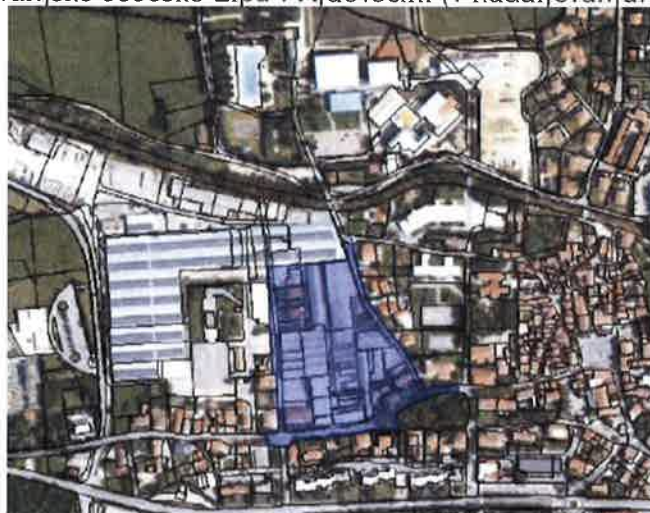
Območje OPPN Lipa

S komunalno opremo novih poslovnih con na južni strani mesta vzdolž hitre ceste so bili izpolnjeni pogoji za selitev poslovnih dejavnosti iz centra mesta. Zaradi spremenjenih okoliščin in velikega pomanjkanja stanovanj, je občina pričela z aktivnostmi za spremembo namembnosti v območje večstanovanjsko gradnjo. Dne 2. 12. 2019 je bil sprejet Sklep o začetku priprave občinskega podrobnega prostorskega načrta za večstanovanjsko sosesko Lipa v Ajdovščini (v nadaljevanju: OPPN Lipa).