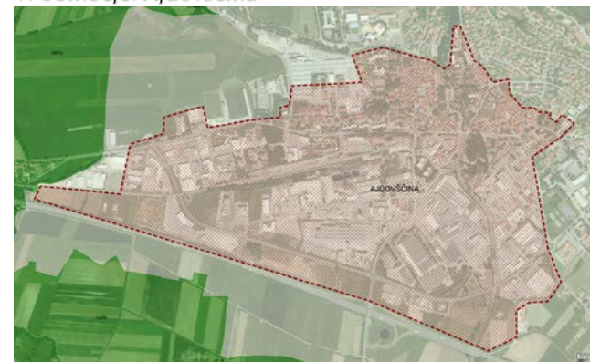
V. območje: Ajdovščina