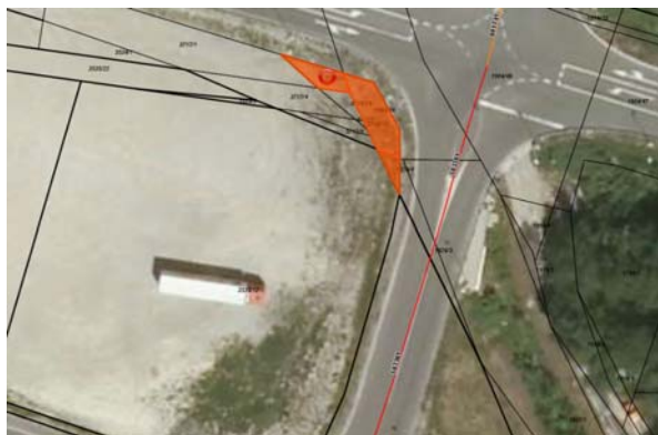
Grafični prikaz parcel 3717/20 k.o. 2391 Vipavski Križ, parc. št. 1904/68 in 1826/4 k.o. 2392 Ajdovščina