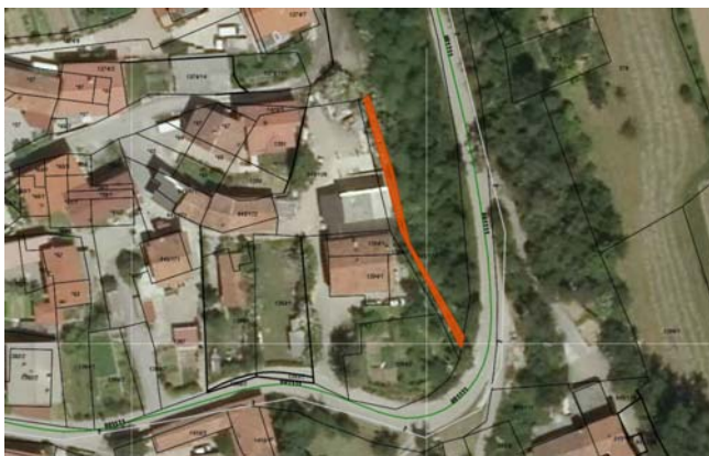
Parc. št. 945/174 k.o. Ustje