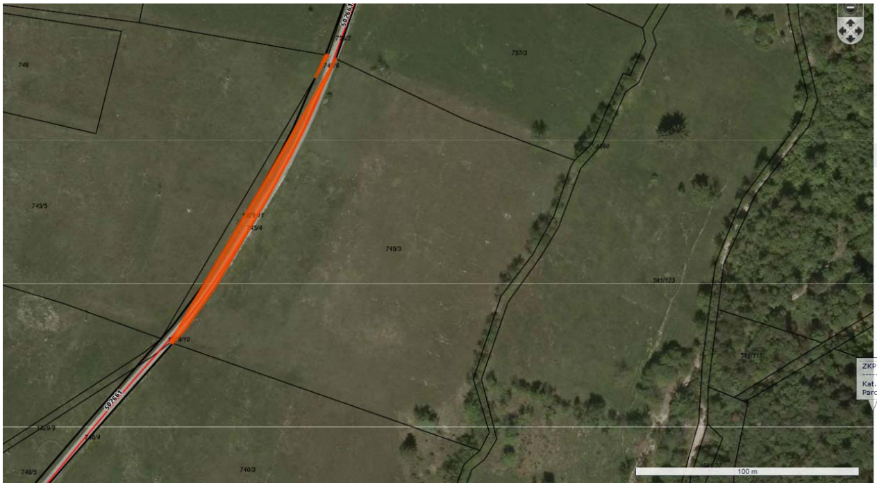
Parc. št. 745/4 in parc. št. 745/6 k.o. 2373 Col