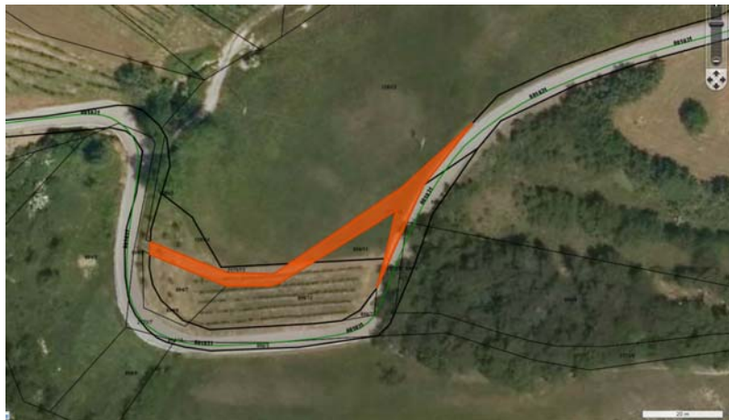
Oranžno označena površina predstavlja parcele (od Z proti V):2171/15, 2171/16, 2171/17, vse k.o. Vrtovin