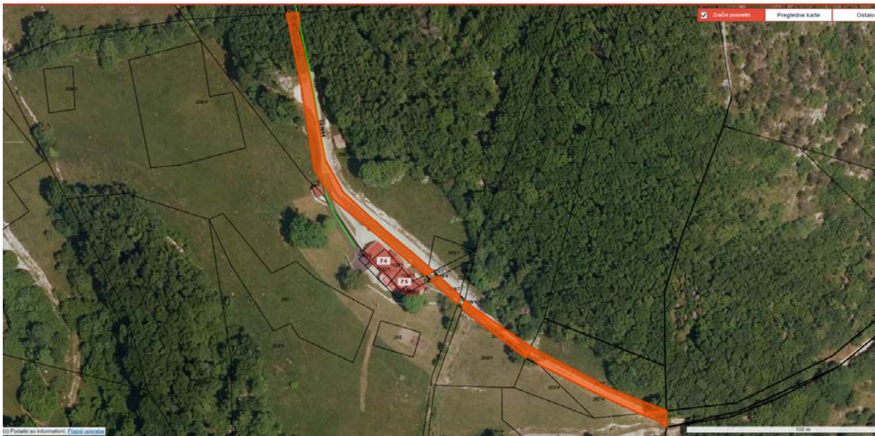
Parc. št. 302/5, 302/7, 304/2, 305/2, 306/3, 307/4, 307/7, 339/7, vse k.o. 2370 Dol-Otlica