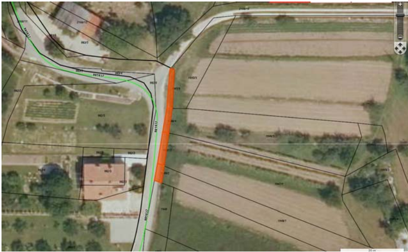
Parc. št. 1945/6, parc. št. 1946/4, parc. št. 1947/2 in parc. št. 1948/2, vse k.o. 2383 Vrtovin