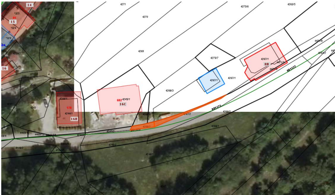
Parc. št. 4268/2 in parc. št. 4267/2, vse k.o. 2396 Šmarje