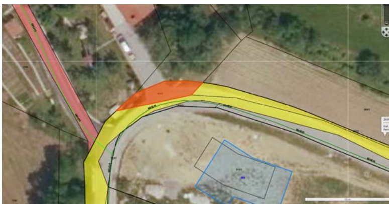
Parc. št. 993/2 k.o. 2383 Vrtovin