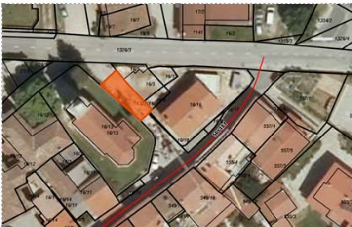
Parc. št. 1327/11 k.o. Selo