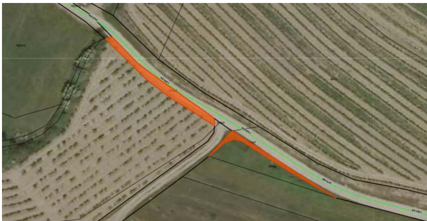
Parc. št. 1919/4, parc. št. 1919/2 in parc. št. 1894/7, vse k.o. 2396 Šmarje