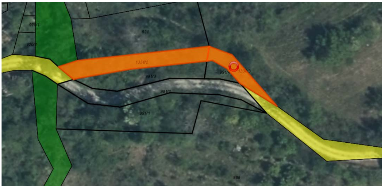
Z oranžno označeni parc. št. 1334/2 in 1334/3 k.o. Stomaž