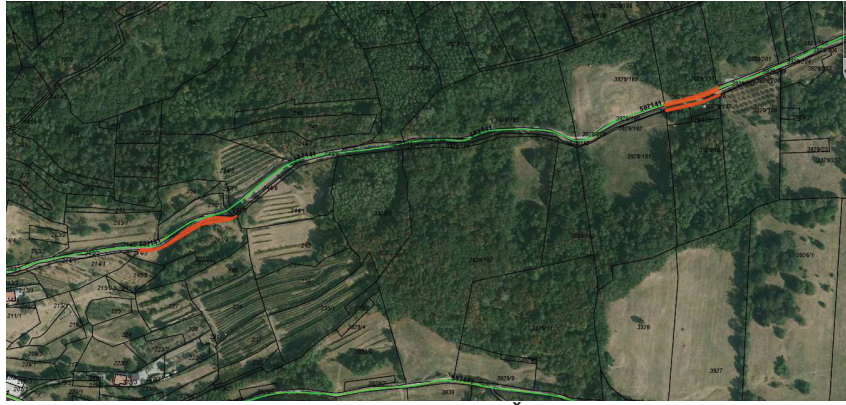
Nepremičnine v k.o. Šmarje