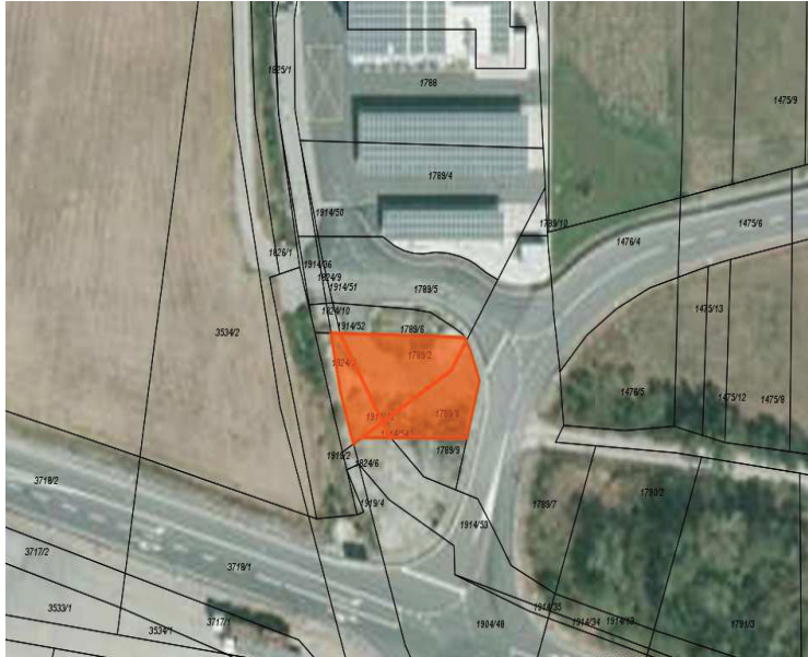
Parcele 1789/2, 1789/8, 1914/54, 1914/48 (Občina izroči Bii S.)