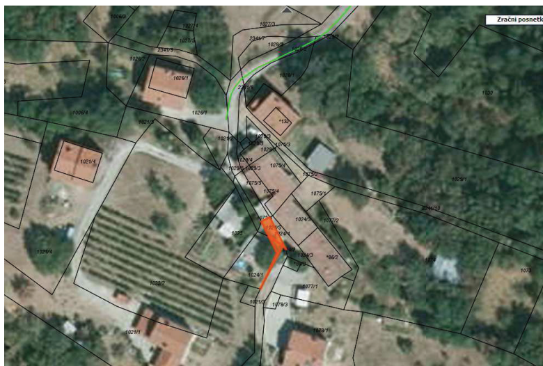
Nepremičnine v k.o. Kamnje