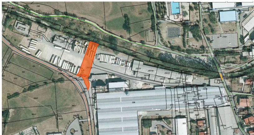
Nepremičnine v k.o. Ajdovščina