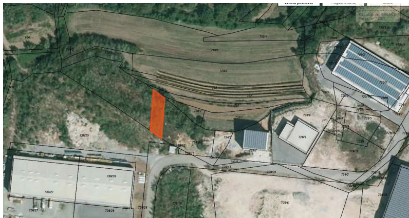
Nepremičnina v k.o. Gojače