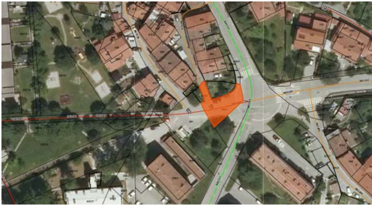
Parc. št. 663/1 k.o. 2392 Ajdovščina