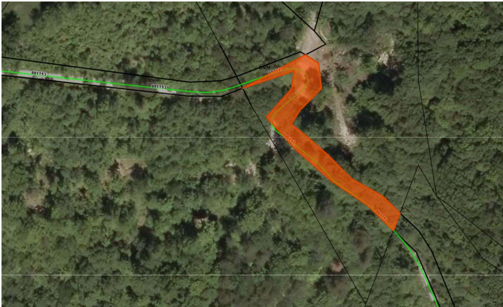
Parc. št. 326/41 k.o. 2376 Višnje