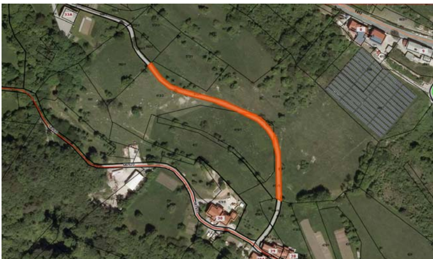
Parc. št. 413/6, parc. št. 416/3, parc. št. 413/7, vse k.o. 2376 Višnje