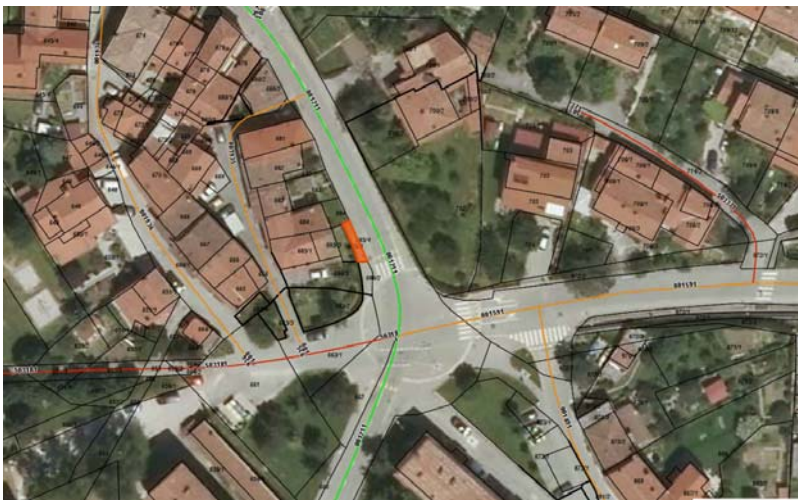
Parc. št. 685/4 k.o. 2392 Ajdovščina