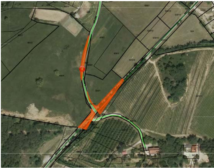
Parc. št. 466/2, 466/6, 466/7, 526/3, 526/4, vse k.o. 2381 Lokavec