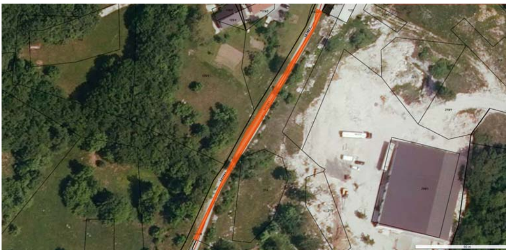
Parc. št. 213/2 k.o. 2370 Dol-Otlica