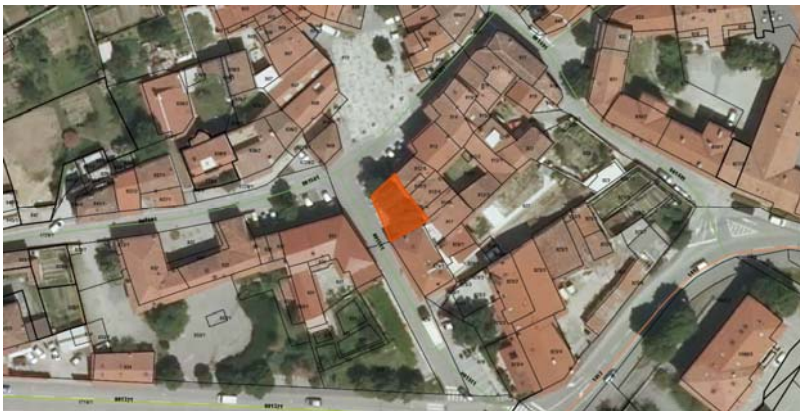
Parc. št. 912/7 k.o. 2392 Ajdovščina