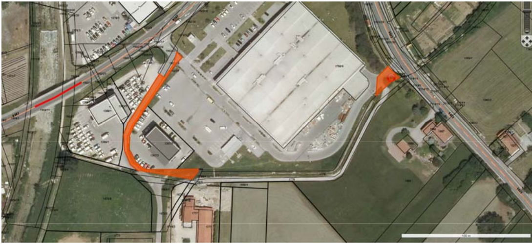
Parc. št. 1780/7, 1780/8 in 1368/2, vse k.o. 2392 Ajdovščina