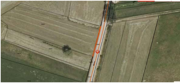
Parc. št. 1639/4 k.o. 2391 Vipavski Križ