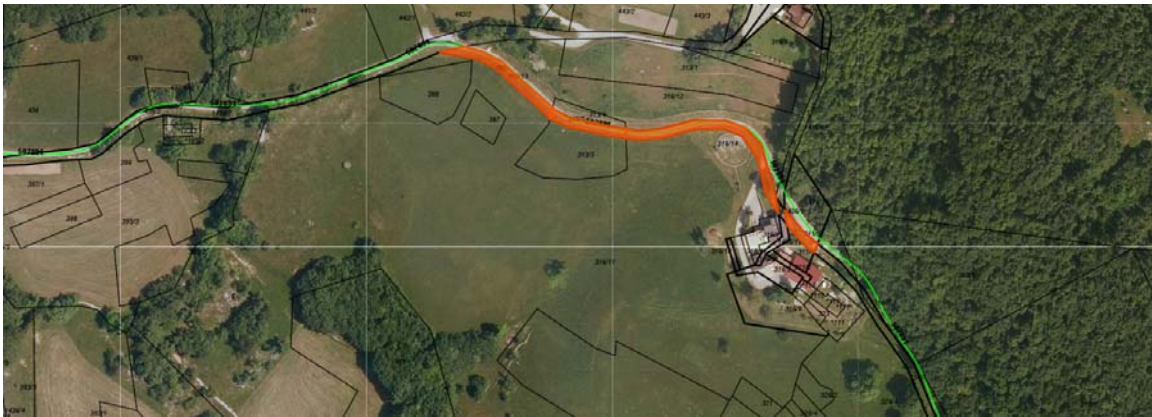
Parc. št. 316/13, parc. št. 311/5, parc. št. 313/5, parc. št. 316/14, vse k.o. 2370 Dol-Otlica