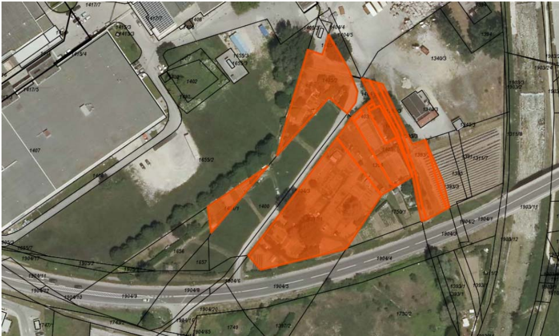
Parcele, v zvezi s katerimi se predlaga odvzem javnega dobra, so oranžno označene