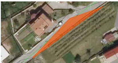
Parc. št. 4295/2 k.o. 2396 Šmarje