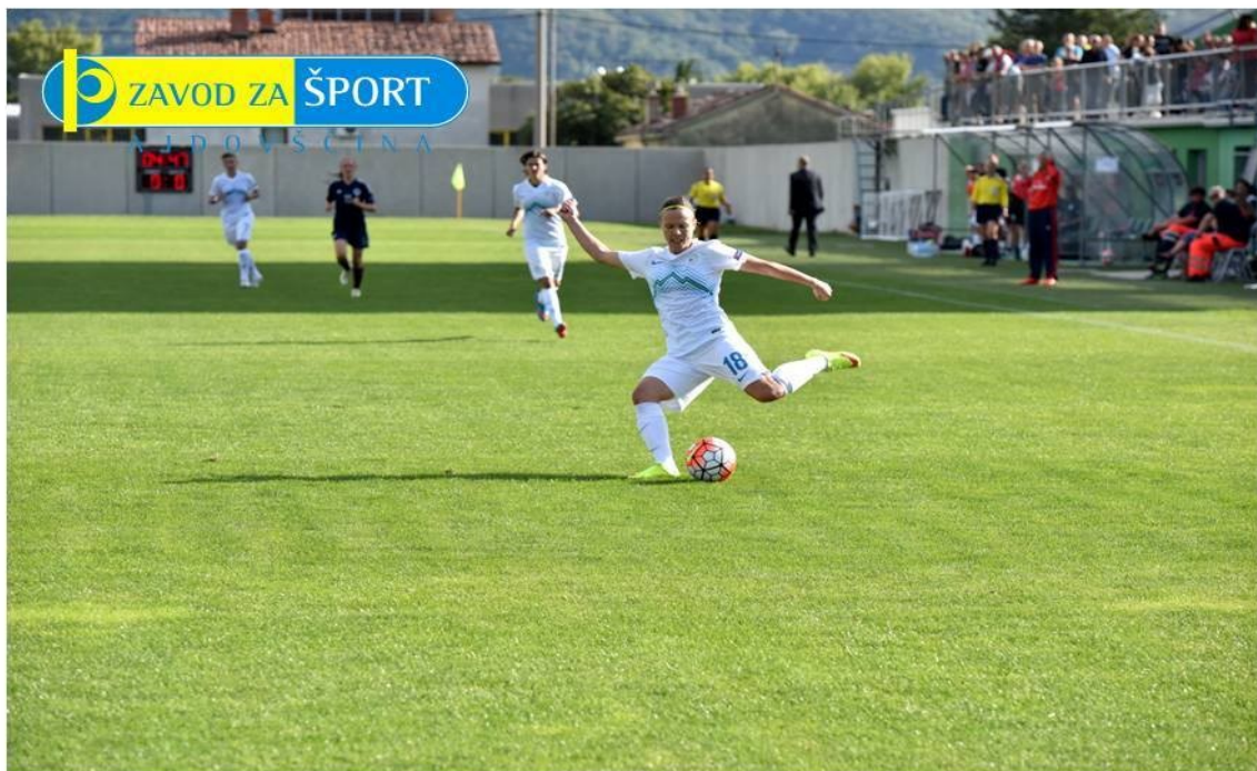
Slika 2: Mestni stadion Ajdovščina