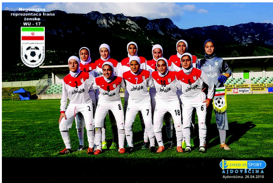
Slika 5: Ženska nogometna reprezentanca Irana 2018