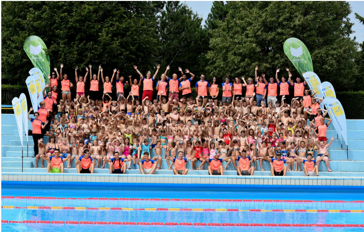
Slika 7: Športne počitnice 2018