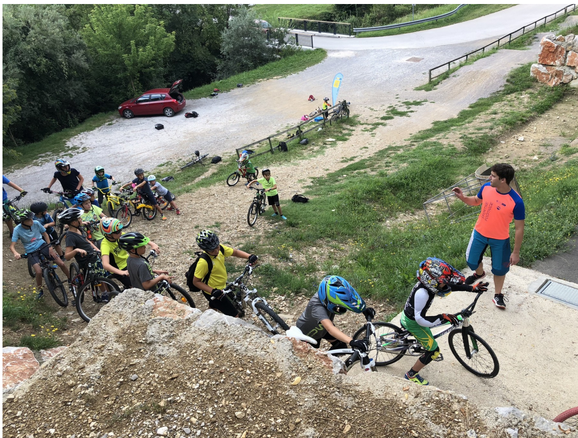
Slika 4: Športne počitnice 2018

Šolska športna tekmovanja organiziramo na občinskem in medobčinskem nivoju. Otroci tekmujejo v športnih panogah, kot so rokomet, nogomet ter košarka. V tekmovanje je bilo vključenih šest osnovnih šol iz Ajdovščine in Vipave.