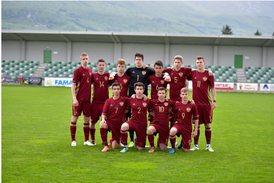
Slika 6: Reprezentanca Rusije 2018