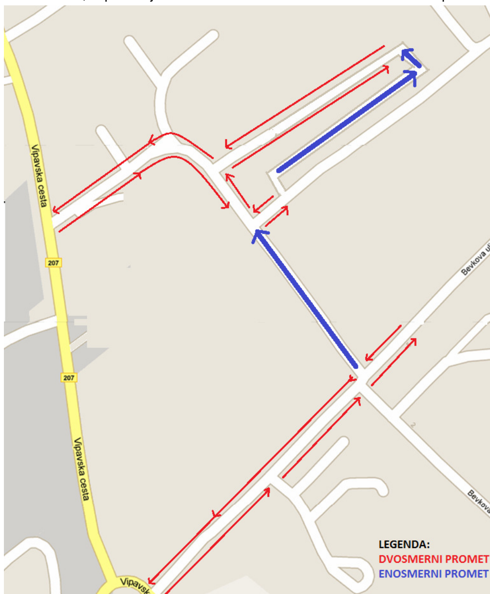
Slika 28: potek prometa na obravnavanem območju

Prometna ureditev neposredno pred OŠ Šturje »izvleček iz študije ureditve prometne signalizacije s predlogi za izboljšanje prometne varnosti«, ki ga je v juniju 2011 izdelalo podjetje SG BIRO d.o.o., Litostrojska c. 44/e, 1000 Ljubljana Glede na prometno situacijo in glede na prometno problematiko predlagamo, da se vodenje prometa na obravnavanem območju spremeni. Promet neposredno pred OŠ Šturje naj poteka zgolj v eni smeri. Promet v eno smer se uredi na odseku Srečko Kosovel – Bevkove ulice od Križišča z Bevkovo ulico – Lavričevo cesto do križišča z nekategorizirano cesto, ki povezuje Srečko Kosovel – Bevkovo ulico in Pot v Žapuže.