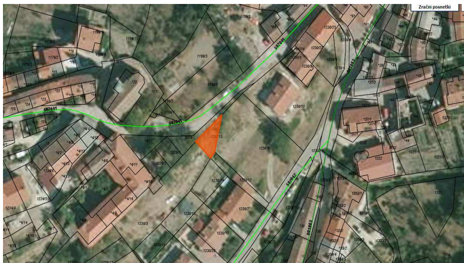
Parcela št. 1230/13 k.o. Velike Žablje (Občina izroči Bat Tomislavu)