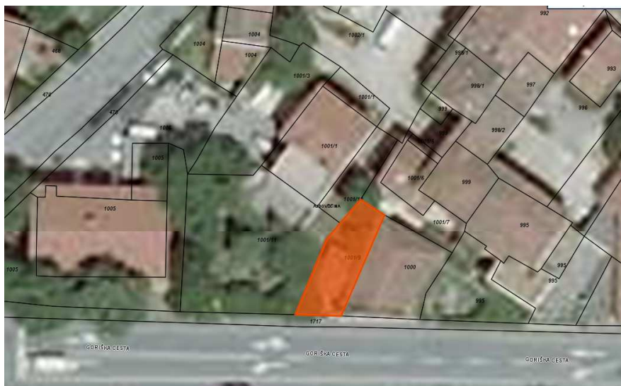
Z oranžno je označena parc. št. 1001/9 k.o. Ajdovščina, ki je predmet