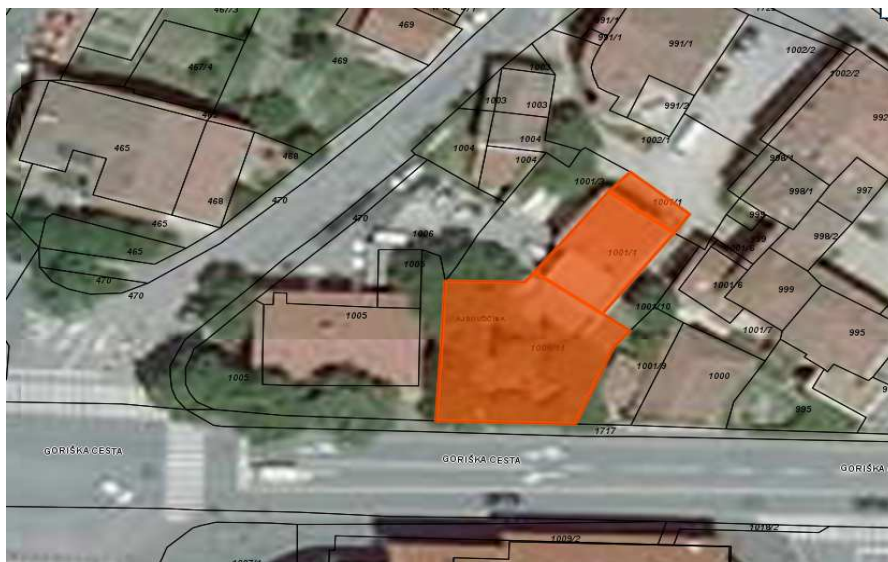
Z oranžno sta označeni parc. št. 1001/1 in 1001/11 k.o. Ajdovščina, na katerih stoji stavba s pripadajočim zemljiščem