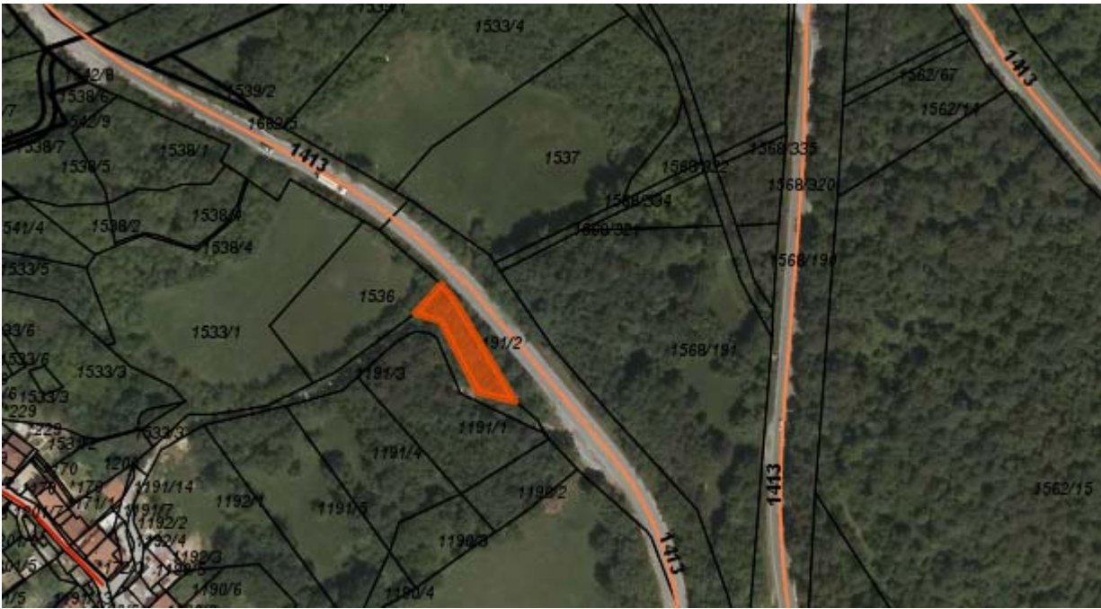
Parc. št. 1191/2 k.o. Šturje