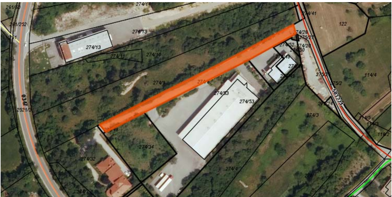
Parc. št. 274/8 k.o. 2384 Črniče