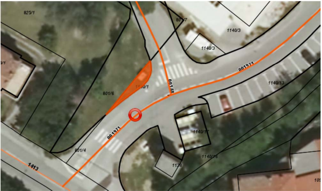
Parc.št. 1140/1 k.o. Ajdovščina