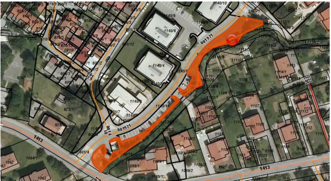
Parc. št. 1140/15, Parc. št. 1140/16, Parc. št. 1137/25, Parc. št. 1137/26 vse k.o. Ajdovščina