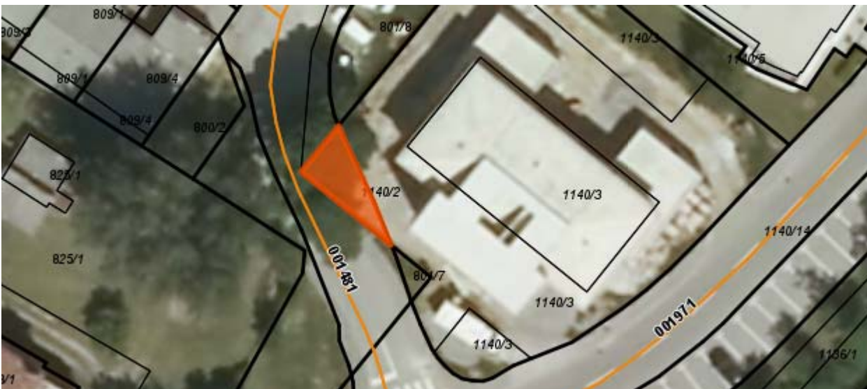
Parc.št. 1140/2 k.o. Ajdovščina