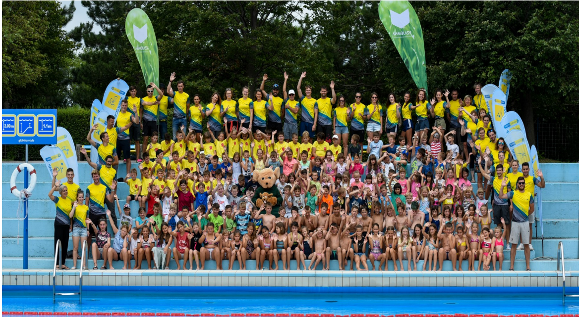
Slika 8: Športne počitnice 2019