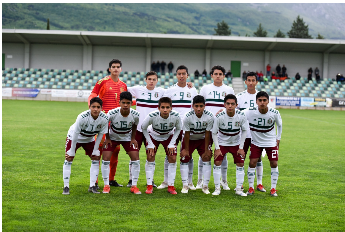
Slika 4: Reprezentanca Mehike 2019

Šolska športna tekmovanja organiziramo na občinskem in medobčinskem nivoju. Otroci tekmujejo v športnih panogah, kot so rokomet, nogomet ter košarka. V tekmovanje je bilo vključenih šest osnovnih šol iz Ajdovščine in Vipave. Usepšno sodelujemo tudi na mednarodnih projektih, trenutno smo aktivni na dveh. Financiranje projektov omogoča Evropska unija s programom Erasmus +. V letu 2019 smo aktivni na projektu Youth Sports Fair Chance, vsebina le tega je boj proti nasilju na in ob igrišču. Ambasador projekta je tudi predsednik države Borut Pahor, ki se je v mesecu septembru udeležil naše promocije projekta v Ajdovščini. V ta projekt smo vključili deset osnovnih šol iz Vipavske doline.