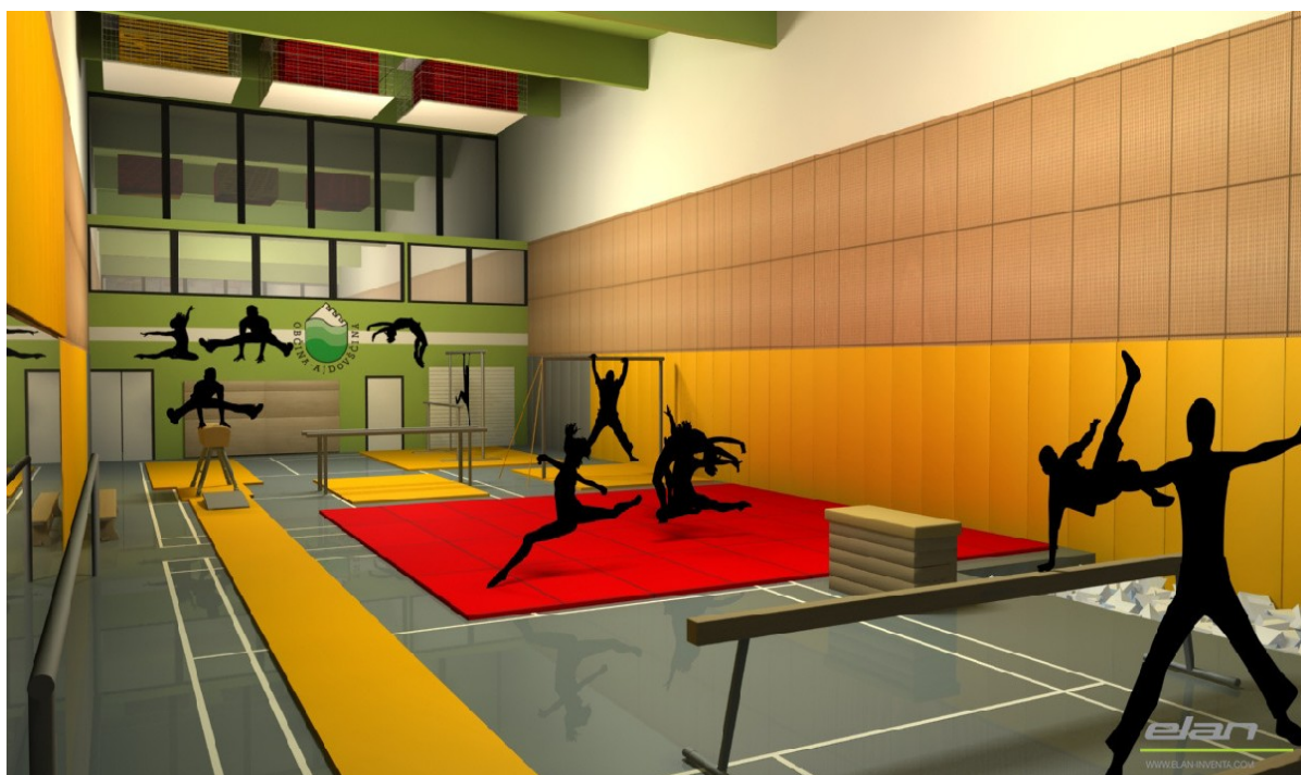
Slika 3: Gimnastična dvorana-idejna zasnova

Zapiranje vmesnega prostora med malo in veliko dvorano z izgradnjo gimnastične dvorane z jamo, ki je večnamenska in se lahko v njej izvajajo različne športne panoge in druge vrste aerobne vadbe v nadstropju ter ureditvijo servisnih