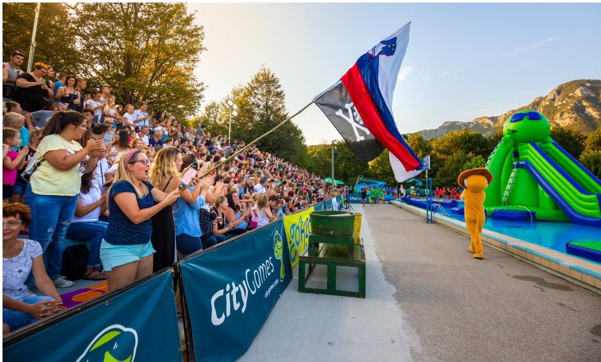
Slika 5: Igre brez meja 2019

Zavod si prizadeva z organizacijo športno rekreativnih in kulturno zabavnih prireditev zapolniti vrzel na tem področju.