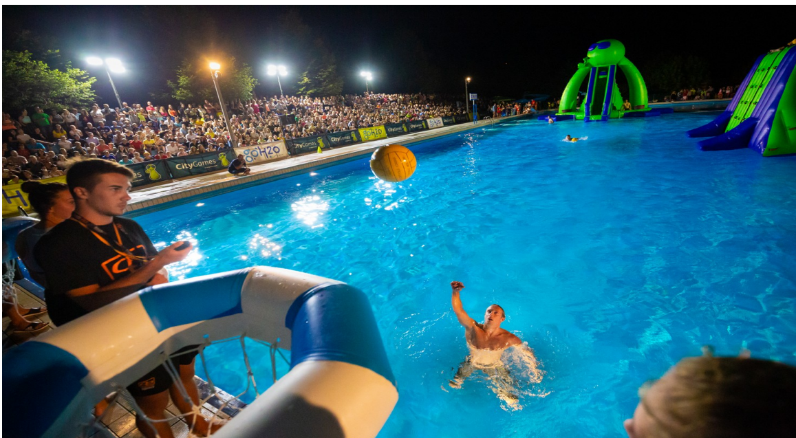
Slika 7: Igre brez meja 2019