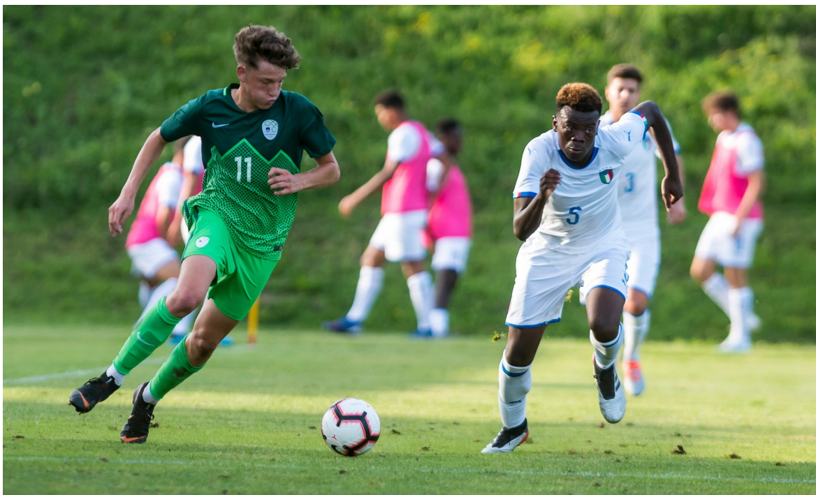
Slika 2: Mestni stadion Ajdovščina