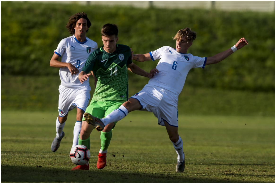
Slika 6: Slovenija : Italija U19 2019