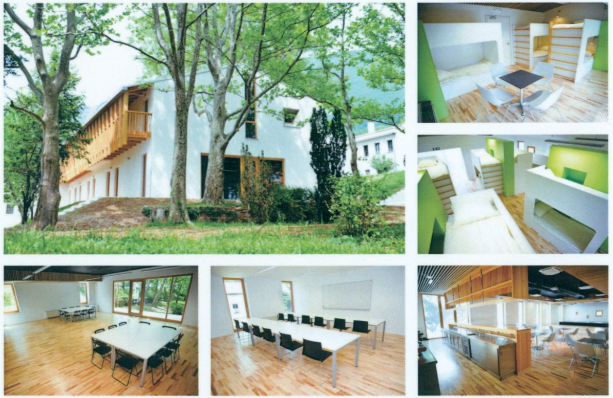
Slika1: Mladinski center in hotel Ajdovščina