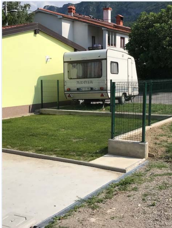
Novejša fotografija – terasa (2017)