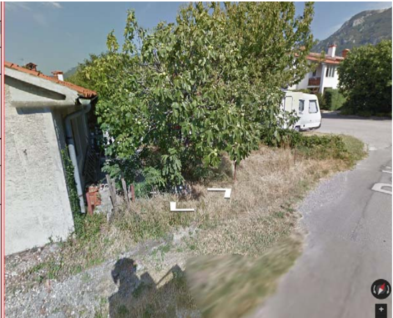
Starejša fotografija - vrt (2014)