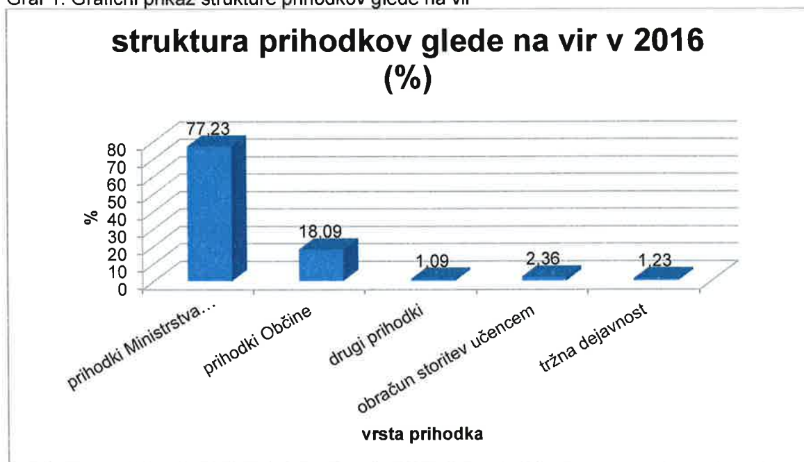
Graf 1: Grafični prikaz strukture prihodkov glede na vir

V preglednici 9 so prikazani prihodki, primerjalno na predhodno leto. Prihodki Ministrstva za izobraževanje, znanost in šport so se malenkostno povečali predvsem zaradi povečanja prihodkov za plače, zaradi povečanja števila zaposlenih.