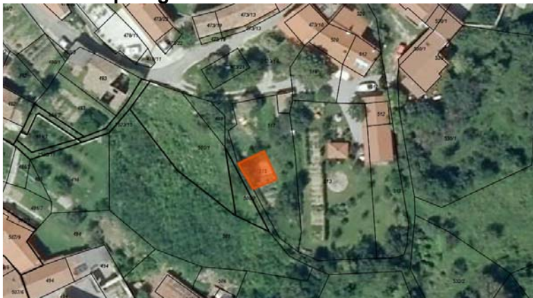
Skica 1 Na skici poudarjena parc. št. 515 k.o. Črniče