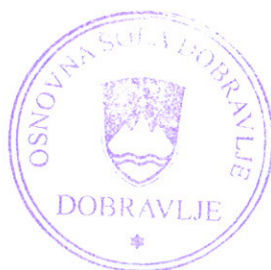
Mirjam Kalin, ravnateljica

Skupaj je bilo torej porabljenih € 58.381,12 sredstev iz presežka iz leta 2015 in preteklih let.