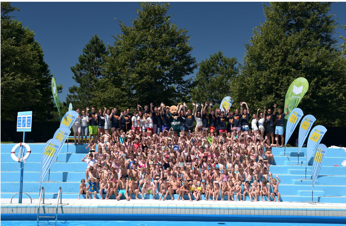
Slika 5: Športne počitnice 2016

Za izpeljavo programov namenjenih predšolskim in šoloobveznim otrokom, pridobivamo sredstva iz javnih razpisov Ministrstva za šolstvo in šport, Fundacije za šport, Zveze za šport otrok in mladine, občine Ajdovščina ter Vipava, sponzorska in donatorska sredstva kar nam zagotavlja kakovostnejšo izvedbo ter posledično večje zadovoljstvo uporabnikov športnega centra.