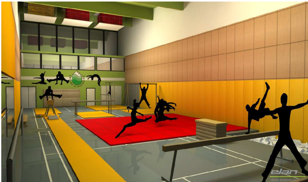
Slika 3: Gimnastična dvorana-idejna zasnova

Zapiranje vmesnega prostora med malo in veliko dvorano z izgradnjo gimnastične dvorane z jamo, ki je večnamenska in se lahko v njej izvajajo različne športne panoge in druge vrste aerobne vadbe v nadstropju ter ureditvijo servisnih prostorov za potrebe nogometnega igrišča v pritličju (garderobe, kabineti, WC-ji, prostori za hrambo orodij), bi dokončno zaključilo ponudbo v ŠC Police. Investicija je smotrna v več pogledih: