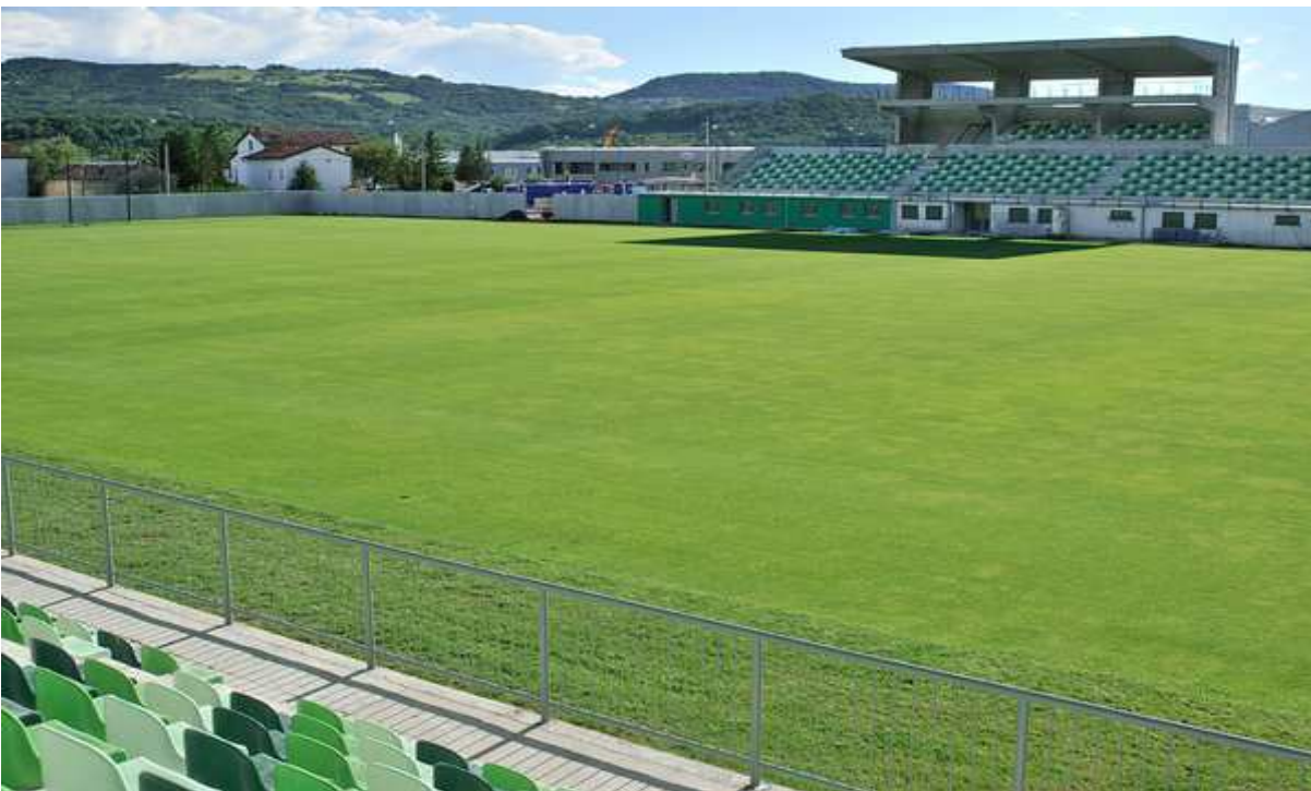
Slika 2: Mestni stadion Ajdovščina