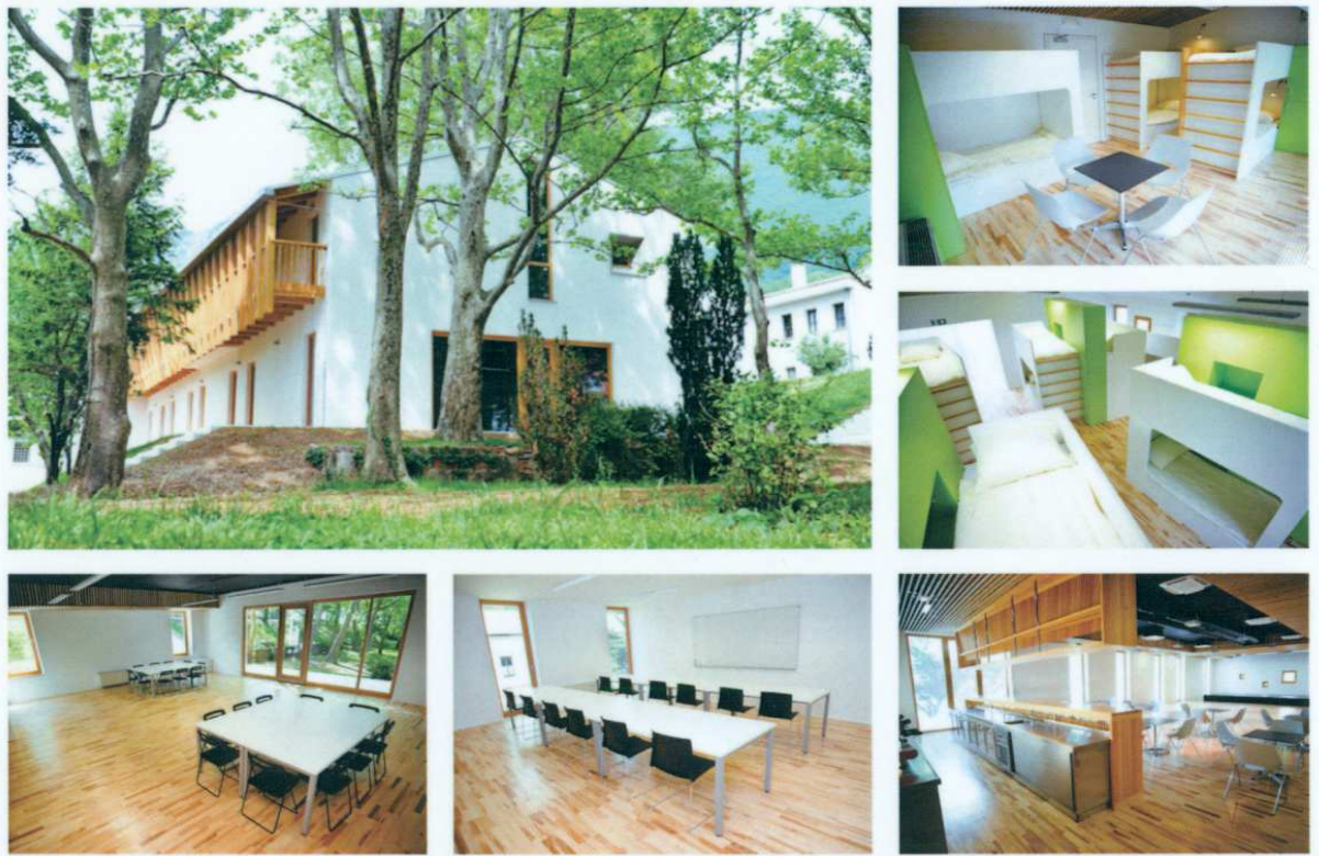
Slika 1: Mladinski center in hotel Ajdovščina