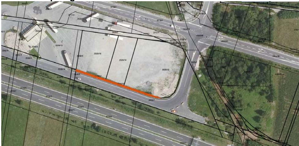
Skica 1 Na skici so označene nepremičnine 3535/13, 3535/15 in 3535/17, vse k.o. Vipavski Križ