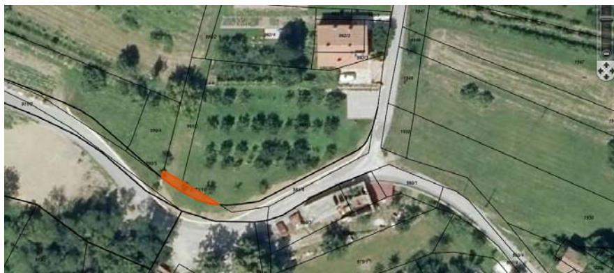
Skica 1 Na skici poudarjena parc. št. 2171/10 k.o. Vrtovin