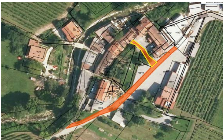
Skica 1 Na skici je z rumeno označen del parc. št. 2173/3 k.o. Vrtovin