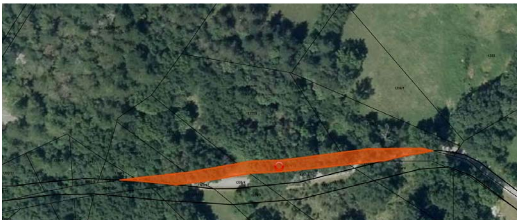
Skica 1 Na skici je označena nepremičnina parc. št. 3034/13 k.o. Lokavec