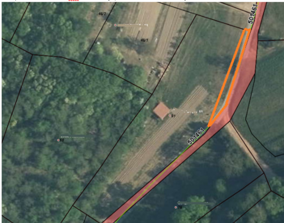
Del parcele št. 61k.o. Dobravlje, ki bi ga Občina Ajdovščina pridobila za cesto