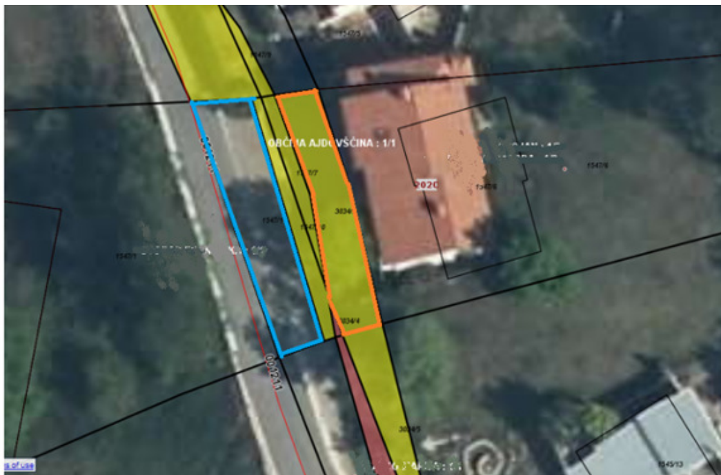
Z oranžno označena parc. št. 3034/3 k.o. Lokavec, ki bi se jo zamenjalo za parc 1547/11 ki je del ceste