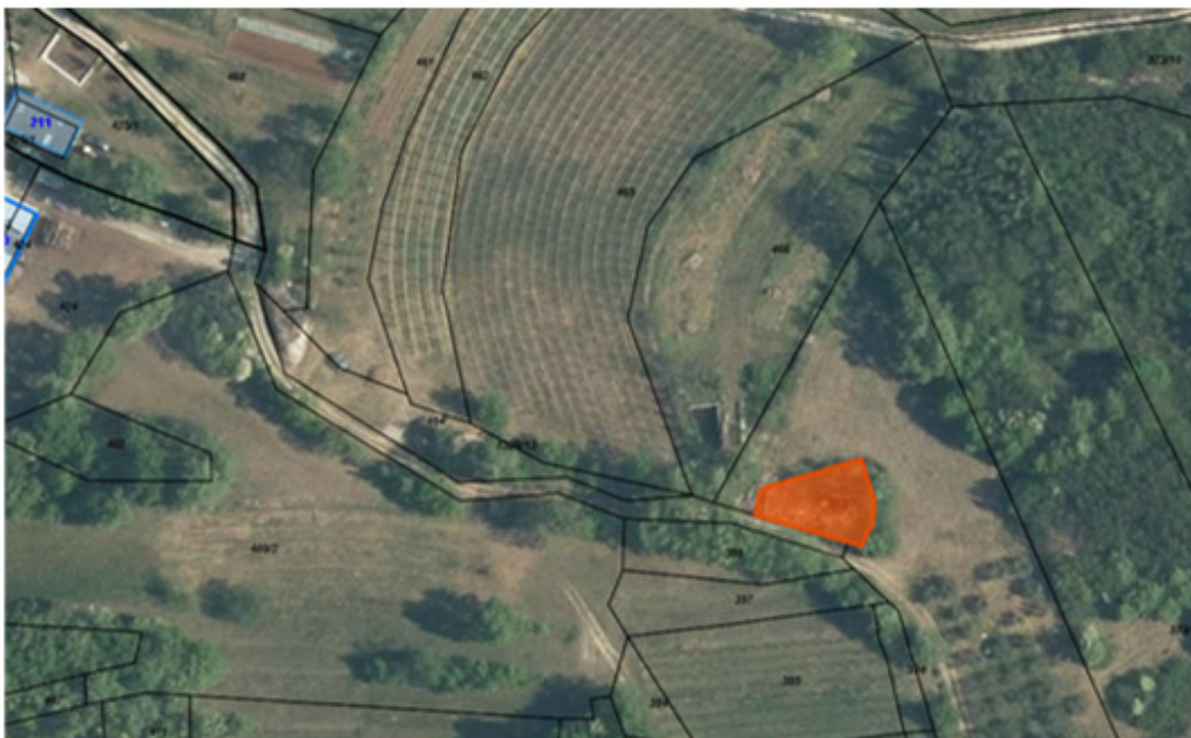
Z oranžno označena parc. št. 373/7 k.o. Selo