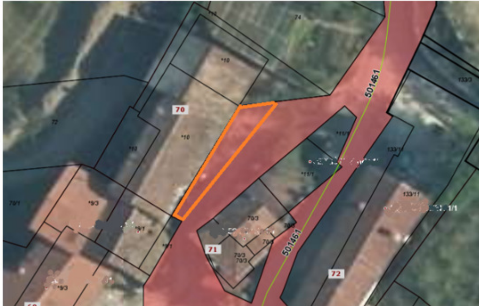
Del parcele 1755/1 k.o. Dobravlje, ki bi se mu odvzelo javno dobro