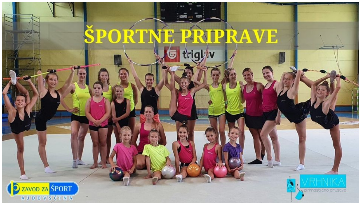
Slika 3: Športne priprave gimnastičnega društva Vrhnika