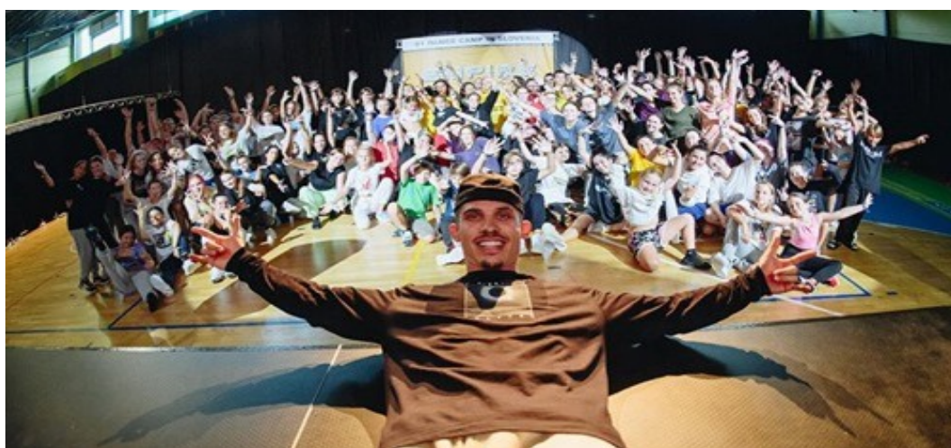
Slika 2: Empire dance 2020

Zavod si z organizacijo športno rekreativnih in kulturno zabavnih prireditev prizadeva zapolniti vrzel na tem področju. Zaradi preprečevanja širjenja COVID-19 so odpadle številne športne prireditve.