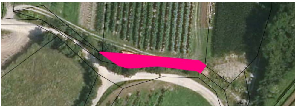
Skica 1 Na skici je označena nepremičnina parc. št. 2278/4 k.o. Planina.