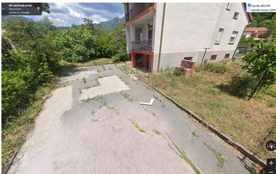
Tadej Beočanin, župan