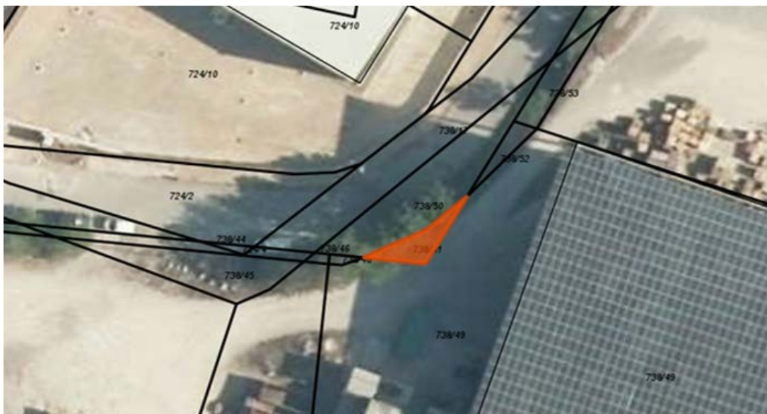
K.o. Gojače, parcela št. 738/51