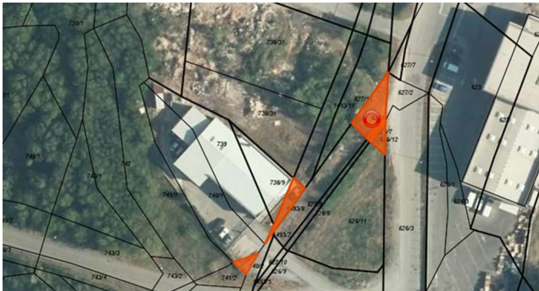
K.o. Gojače, parcele št.: 740/2, 1493/7, 1493/8, 626/12, 626/7 in 627/8