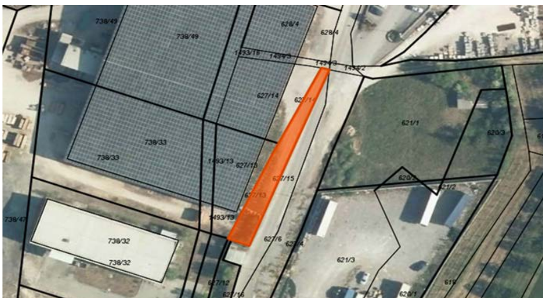
K.o. Gojače, parcela št. 627/15