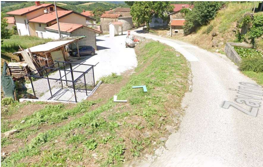
Parc. št. 4482/9 je površina levo od cestišča z bankino