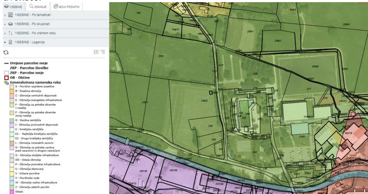
Slika: Namenska raba prostora

Na območju urejanja površine cca 1,4 ha je predvidena gradnja 20 oddelčnega vrtca v več fazah. Strokovna podlaga za izdelavo OPPN Vrtec je bila idejna zasnova IZP, ki jo je izdelal Arhitekturni biro ACMA d.o.o., pod št. 2020-3 v marcu 2020. Vrtec je zasnovan kot dvoetažni objekt P+1. Sestavljajo ga tri lamele pravokotne oblike, ki tvorijo notranje dvorišče.