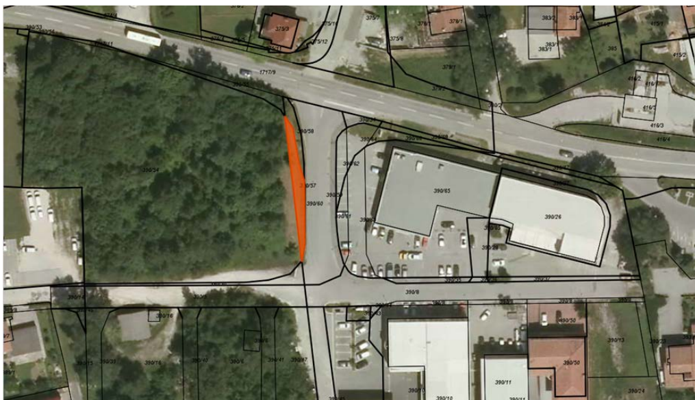
Oranžno označena parcela parc. št. 390/57 k.o. Ajdovščina (Goriška cesta).